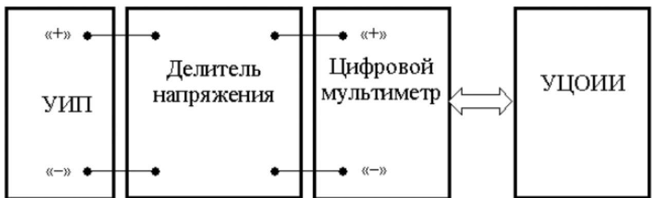
Рис. 1.3.2 Схема соединения приборов при выполнении работы

В процессе выполнения работы измеряется постоянное напряжение, значение которого лежит в диапазоне от 2 до 30 мВ. В этом случае для проведения измерений может подойти или цифровой вольтметр или компенсатор (потенциометр). Однако выполнять серию из нескольких десятков наблюдений с помощью компенсатора крайне неудобно. Поэтому в работе используется цифровой измеритель постоянного напряжения, а для уменьшения трудоемкости измерений выбран такой режим его работы, когда по стандартному интерфейсу осуществляется автоматическая передача результатов наблюдений от модели цифрового мультиметра к модели цифрового устройства обработки измерительной информации (рис. 1.3.2).