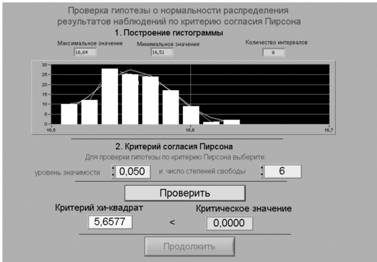
Рис. 1.3.4 Вид рабочего стола при проверке гипотезы о нормальном распределении по критерию согласия Пирсона